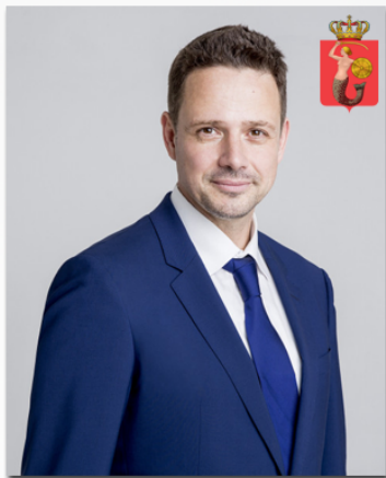
Rafał Trzaskowski Warszawa

Popularność prezydentów polskich miast w mediach społecznościowych na tle liczby mieszkańców miasta, którym zarządzają