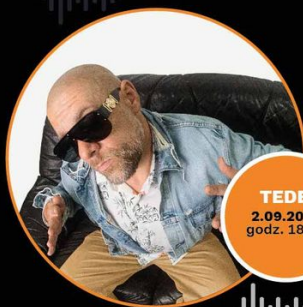
TEDE 2.09.2023 godz. 18:30