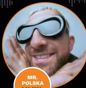
MR. POLSKA 2.09.2023 godz. 20:00

STREFA GASTRO STREFA PARTNERÓW MŁODZIEŻOWY ART PATROL STREFA AKTYWNOŚCI PARK ROZRYWKI