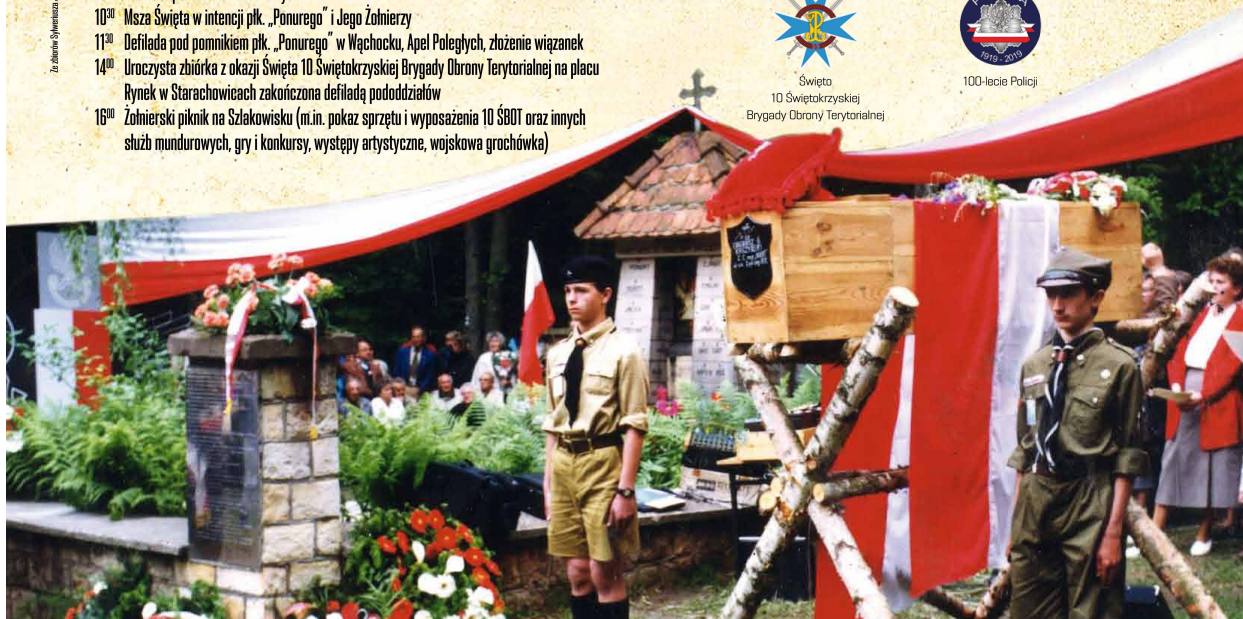
Wspierca organizacyjna i finansowa w organizacji uroczystości