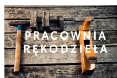
PROWADZI RADOŚLAW PŁUSA