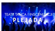
PROWADZĄ ALICJA ANDRZYKOWSKA KATARZYNA LIPIEC