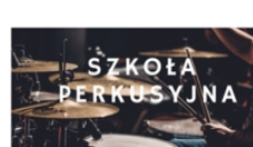
PROWADZI GRZEGORZ DZIAMKA