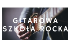
PROWADZI KRZYSZTOF STANIK