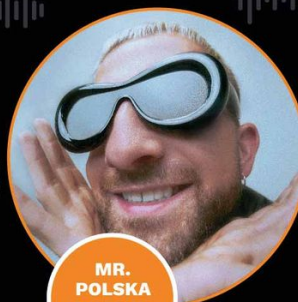
MR. POLSKA 2.09.2023 godz. 20:00

STREFA GASTRO STREFA PARTNERÓW MŁODZIEŻOWY ART PATROL STREFA AKTYWNOŚCI PARK ROZRYWKI