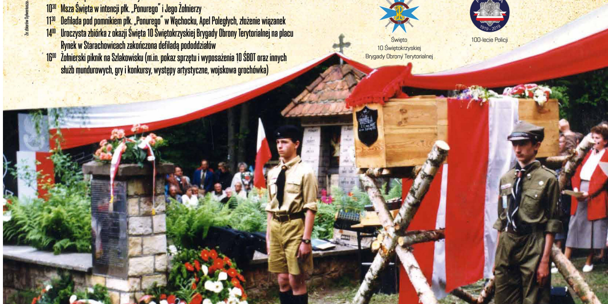
Wspiercy organizacyjnej i finansowej w organizacji uroczystości