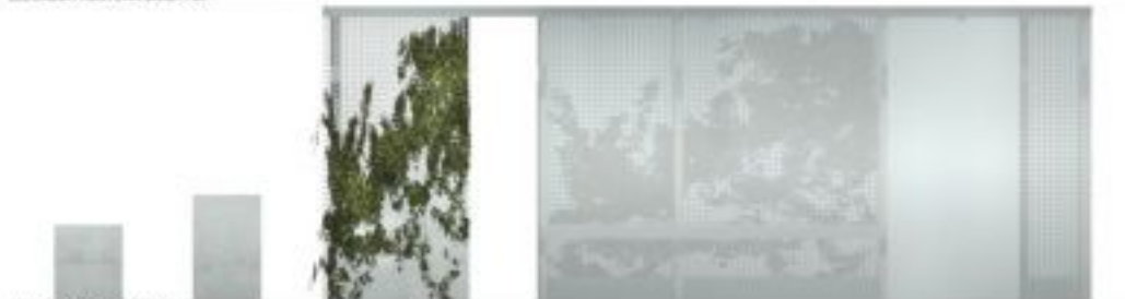
WIDOK WIDOKU TYLNA SKALA 1:20

II Miejsce (ex.) Praca nr 542862 - uzyskała w ocenie 418 punktów (na 600 możliwych)