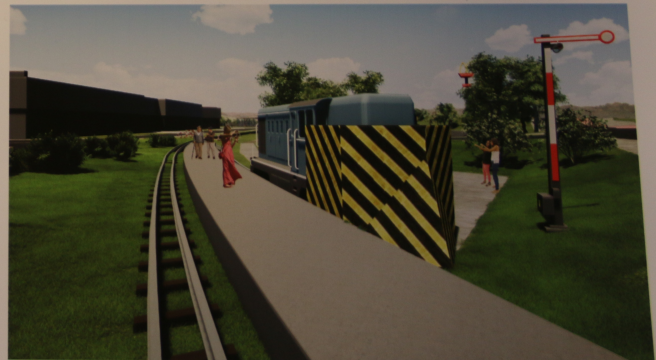
Peron osobowy z pługiem odśnieżnym