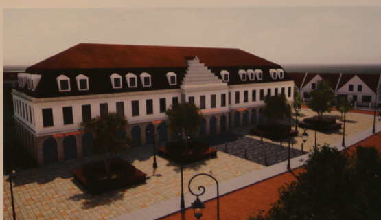
Projektowany plac miejski oraz Dom Kultury