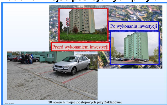
18 nowych miejsc postojowych przy Zakładowej

Cel: Budowa miejsc postojowych dla samochodów osobowych. Poprawa bezpieczeństwa ruchu drogowego oraz wizerunku modernizowanego terenu przy ul. Zakładowej.