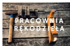
PROWADZI RADOŚLAW PŁUSA