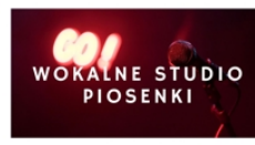
PROWADZI PIOTR MRÓZEK