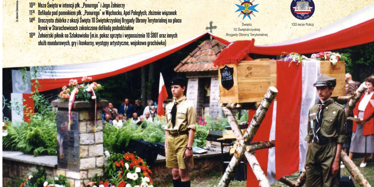
Wspierca organizacyjna i finansowa w organizacji uroczystości